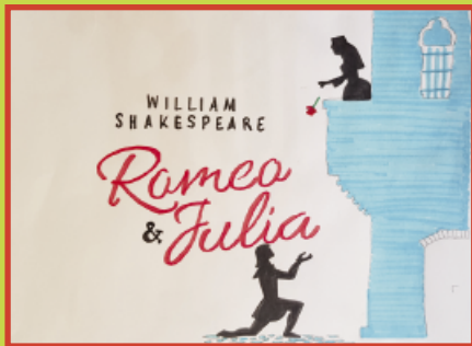
Darstellen und Gestalten